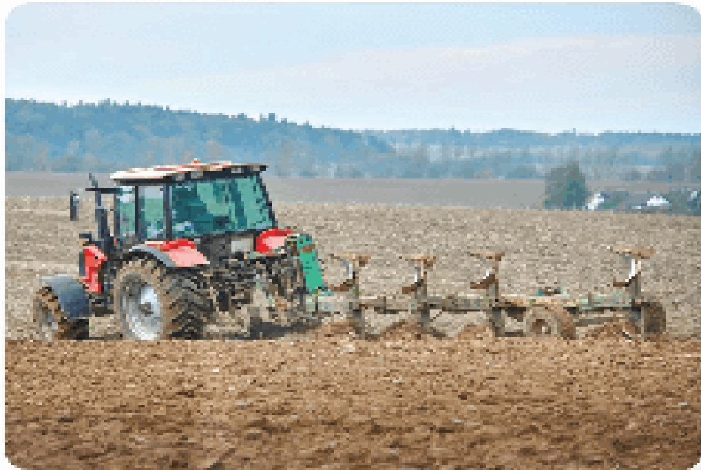
a) Làm tơi đất