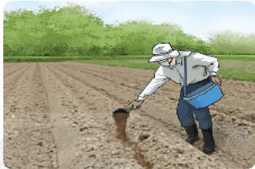
b) Bón phân hữu cơ cho đất